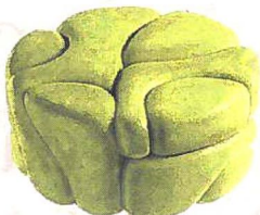
Ironico Tavolino/seduta Pietre, di Soft Barock per Gufram, serie limitata