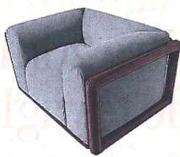
Revival Poltrona Cornaro, di Cassina, design Carlo Scarpa, riedizione del pezzo del 1973