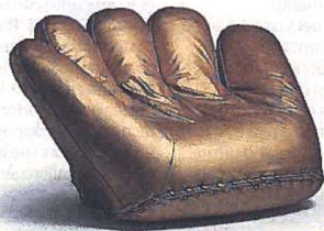
Iconica Poltrona Joe, design De Pas, D'Urbino, Lomazzi per Poltronova, rivestita in pelle oro. Edizione speciale per il 50esimo anniversario