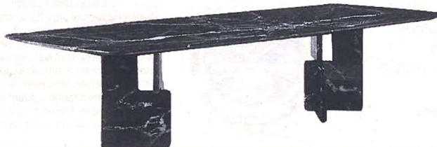
Sculptoreo Tavolo nico, design Hannes Peer per Minotti: in più varianti di marmo o con piano in frassino, è disponibile anche ovale